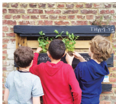
Les jeunes madeleinois s'occupant du potager au Centre Moulin Ados

Les adolescents eux aussi n'auront pas le temps de s'ennuyer au Centre Moulin Ados et pourront préparer leurs valises, direction Ancelles !