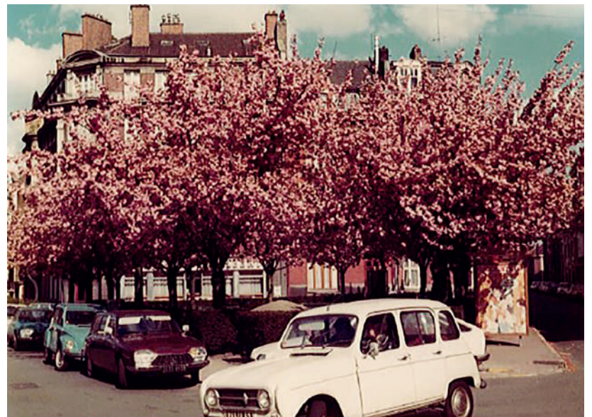
La place Massenet au milieu des années 70. Archives municipales de La Madeleine, fonds Henri Sohier

Tous les 4 juillet, jour de la Fête Nationale américaine, un drapeau des États-Unis est hissé sur cette place. Ceci pour rendre hommage aux troupes américaines qui occupèrent non loin de là, l'immeuble du 251 avenue de la République, durant la Seconde Guerre mondiale. À cette période, on procédait matin et soir, en fanfare, à la montée du drapeau. À leur départ, les soldats américains ont offert un drapeau à la Ville. C'est donc en souvenir de cet épisode qu'il a été décidé de commémorer tous les ans l'Indépendance Day sur la place Massenet.