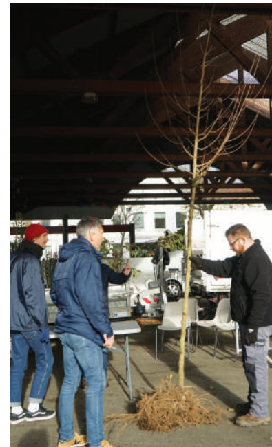
Les agents des espaces verts se tiennent aussi à la disposition des Madeleinois qui souhaitent bénéficier de conseils pour entretenir leur patrimoine arboré.