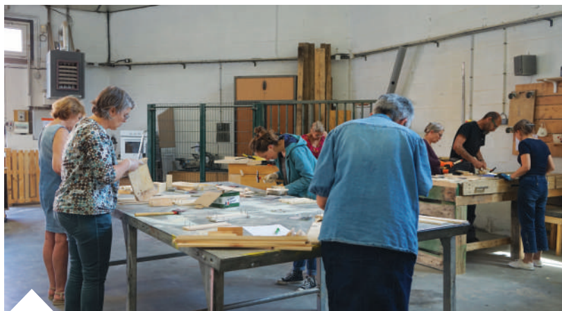
Dans le cadre de la 3 ème édition du défi zéro déchet madeleinois, les participants ont fabriqué des jardinières à la bricothèque municipale avec des palettes de bois récupérées, guidés par l'agent municipal spécialisé en bricolage. Vous souhaitez rejoindre le défi ? Rendez-vous sur familleszerodechet.fr

Vous souhaitez bricoler mais vous ne disposez pas d'un espace suffisant à votre domicile ? Rendez-vous à la bricothèque !