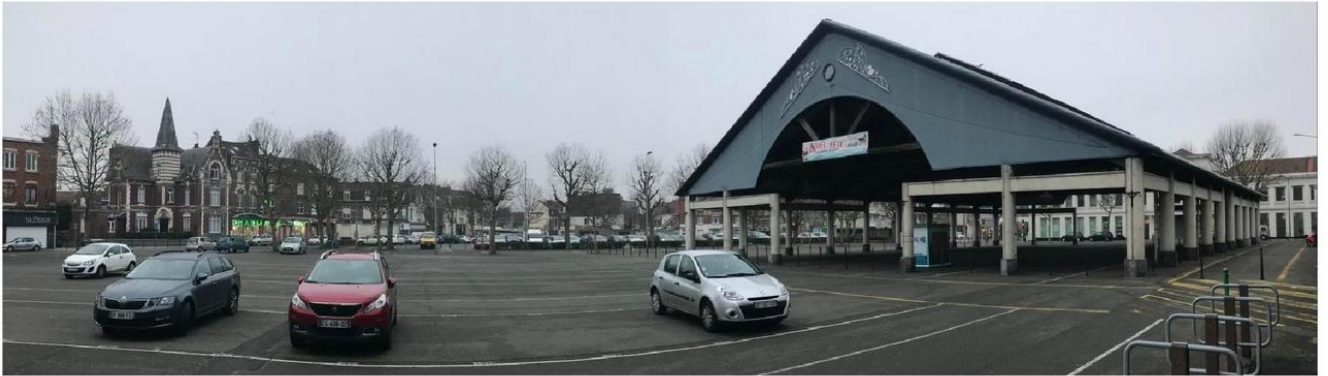
Choisir son projet d'aménagement préféré de la place du marché parmi trois sera possible dans un premier temps via le site internet de la ville, à partir du 9 février.